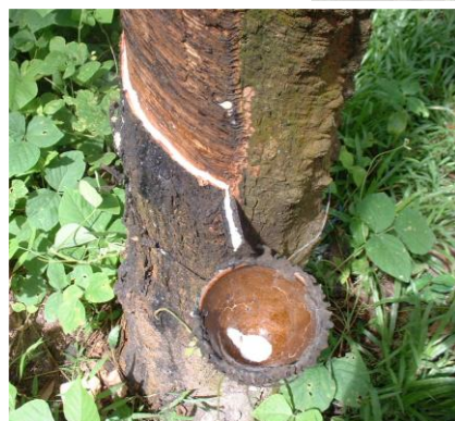
Thailand, der grösste Exporteur von Natural Gummi, 95 % der Produktion stammt aus Familienbetrieben, mit Flächen weniger als 8 Ha